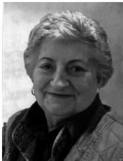
Revello Romana in Borgna