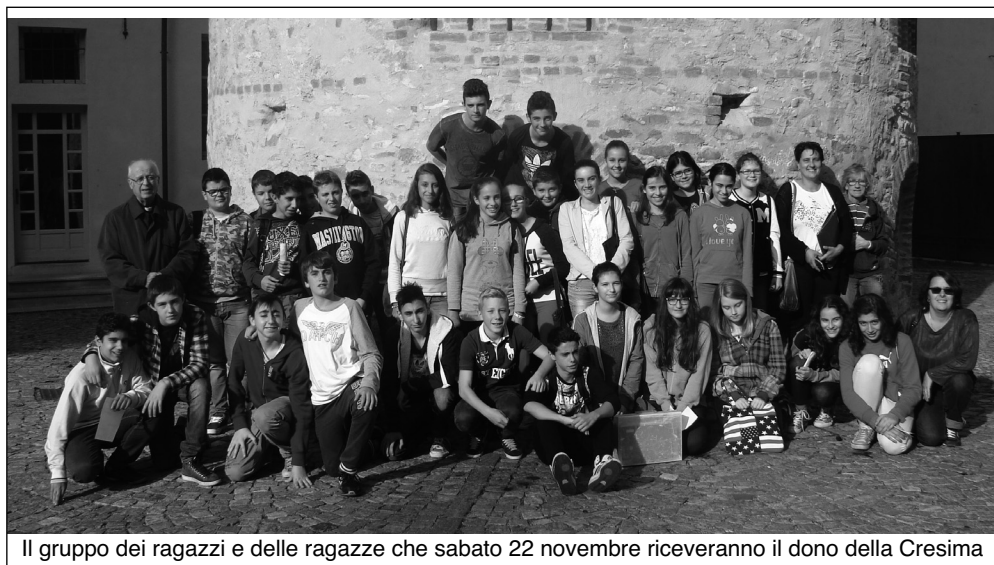
Il gruppo dei ragazzi e delle ragazze che sabato 22 novembre riceveranno il dono della Cresima

La festa vera è altro. Almeno così dovrebbe essere l'idea di Dio che l'ha inventata per noi, prima che per sé. Basterebbe pensare che la domenica è un giorno da "spendere bene", nel relax per sé e con gli altri, ma soprattutto con Gesù, che ha inaugurato la "sua e nostra domenica" risorgendo il mattino di Pasqua. E fu una festa straordinaria!