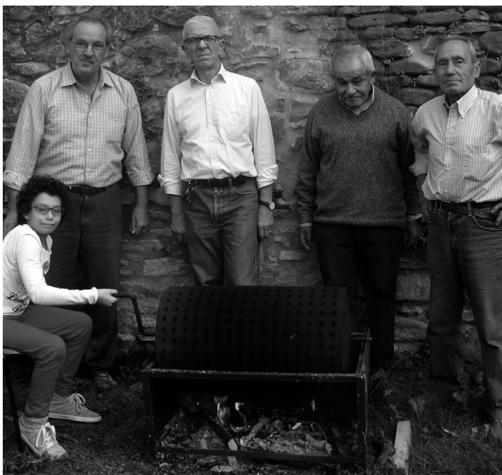
Gli amici della Pro-Loce di Castello mentre preparano la castagnata per i ragazzi dell'Oratorio e per gli ospiti del San Giuseppe