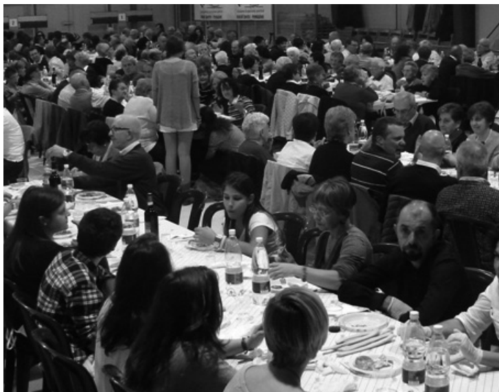
La Bocciofila trasformata in Sala Ristorante, completamente gremita in ogni sua parte. Dalla cena (dedotte le spese) 4645; dalla lotteria 2975.