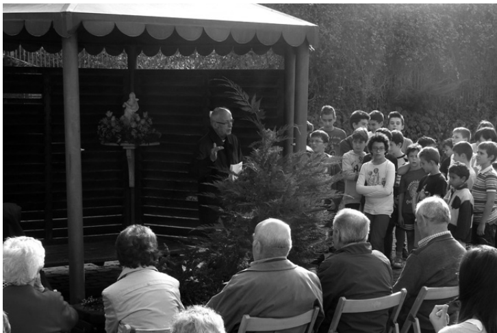
La Benedizione della statua della Madonna sul terrazzo adiacente al San Giuseppe